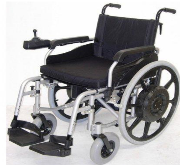
Кресло-коляска с электроприводом и ручным управлением для инвалидов Инкар-М КАР-4.1.

Количество вновь созданных рабочих мест – 5 Увеличение выручки на 13,9 млн. руб. (8,5 %)