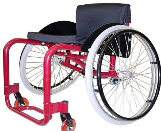
Кресло-коляска Инкар-М Стриж- Люкс

ООО «Научно-производственное предприятие «Инкар-М»