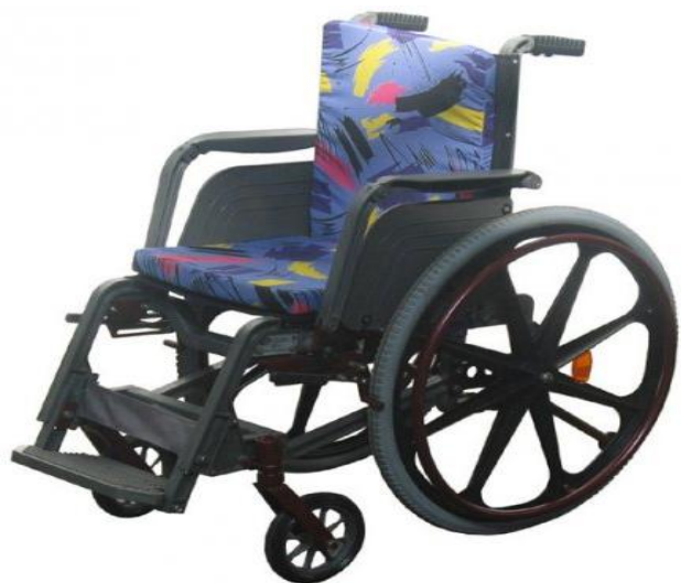
Кресло-коляска для детей от 7 до 15 лет Инкар-М КАР-1

Количество вновь созданных рабочих мест – 5 Увеличение выручки на 13,9 млн. руб. (8,5 %)